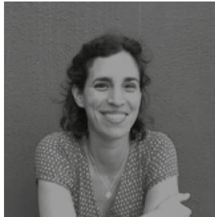
Alicia Izquierdo MTM Ediciones

ACVIC Centre d'Arts Contemporànies es un equipamiento cultural público para promover la creación, la investigación, la producción y la difusión de propuestas impulsadas desde prácticas artísticas contemporáneas. Es un proyecto comprometido con su entorno inmediato, a la vez que persigue el diálogo con el contexto nacional e internacional, para difundir su propia actividad, para acoger e interactuar con experiencias, artistas y actores culturales externos. Fomenta el trabajo en red y el desarrollo de proyectos desde una lógica de coparticipación, colaboración y coproducción.