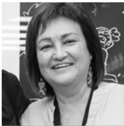
Carmina Borbonet Museu del Disseny

La Organización Española para el Libro Infantil y juvenil ( OEPLI ), se constituyó formalmente el 27 de julio de 1982, cuyo principal objetivo es la de realizar, programar y ejecutar proyectos, iniciativas y todo tipo de actividades de promoción del libro infantil y de la lectura, así como asumir la representación en España del IBBY (International Board on Books for Young People)