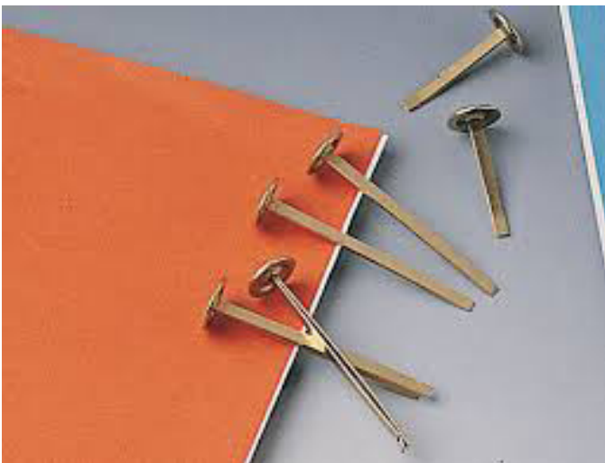
Muestra de pieza encuadernadora